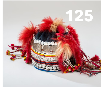
Guido Sprenger Kopfschmuck einer Akha-Frau, Thailand