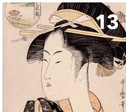
Robert Bitsch Der japanische Farbholzschnitt zwischen Gebrauchsgrafik und Kunst