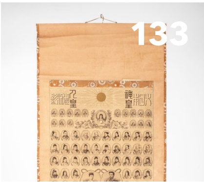
Melanie Trede Eine japanische Kaisergenealogie: modern, transkulturell