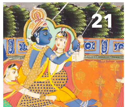
Christiane Brosius Auf immer und ewig? Liebe in Indien in Zeiten von Valentinstagen