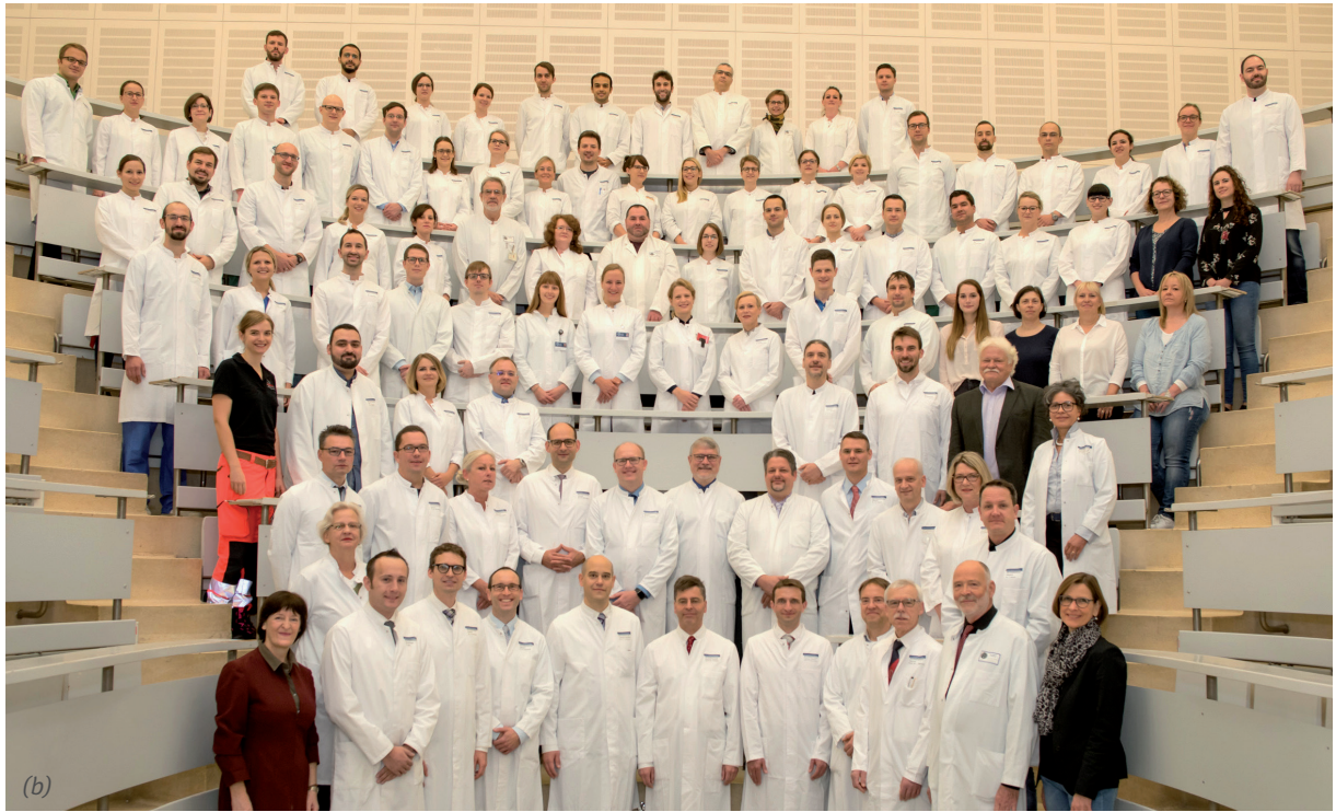
Abbildung 6.1: und (b) im Jahr 2017.