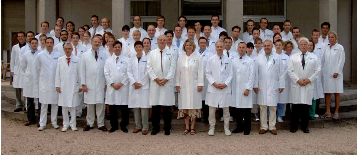
Abbildung 6.1: Das Team der Klinik für Anästhesiologie (a) im Jahr 2007.