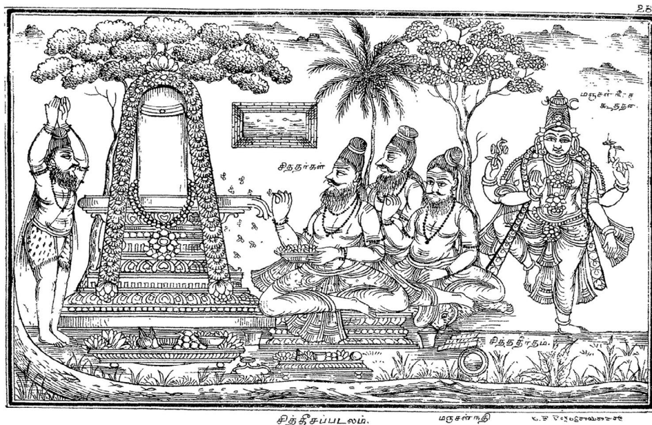
Abb. 4: Illustration der Ursprungsgeschichte des Siddhesvara-Tempels.

deutsche Übersetzung kann dem nur ansatzweise Rechnung tragen. Inhaltlich folgt das KP seiner Sanskrit-Vorlage aber sehr eng. Im Fall der vorliegenden Textpassage besteht die einzige nennenswerte Abweichung darin, dass das KP den (im KM in der Tat etwas redundanten) Schlussteil abkürzt. In textkritischer Hinsicht macht die große Anzahl der (oft fehlerhaften oder unsinnigen) Varianten im KM, die prekäre Überlieferungssituation dieses Textes deutlich. Auch die 1889 erschienene erste Druckausgabe ist häufig unzuverlässig, sodass die durch das Projekt erstellte Neuausgabe die Beschäftigung mit dem Text auf eine weitaus solidere Grundlage stellt. Im Vergleich zum KM besitzt das tamilische KP eine sehr viel stabilere Überlieferungssituation mit nur wenigen abweichenden Lesarten.