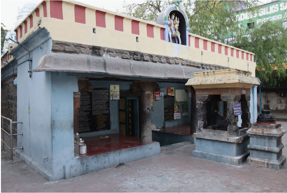
Abb. 3: Der Siddhesvara-Tempel in Kanchipuram.

nahm, nachdem sie Gelbwurzpaste auf ihren Körper aufgetragen hatte. Das Wasser, in dem sie badete, verwandelte sich in einen Fluss namens Mañcaḷ Nīr oder ‚Gelbwasser‘, was wiederum Shiva dazu veranlasste, sich in Form eines Lingas am Ufer dieses Flusses zu manifestieren. Diese Geschichte erklärt somit sowohl den Ursprung des Mañcaḷ-Nīr-Flusses, eines Flüsschens, das an dem Tempel vorbeifließt, als auch den des Lingas, also des nicht-figürlichen Götterbilds im Allerheiligsten des Tempels.