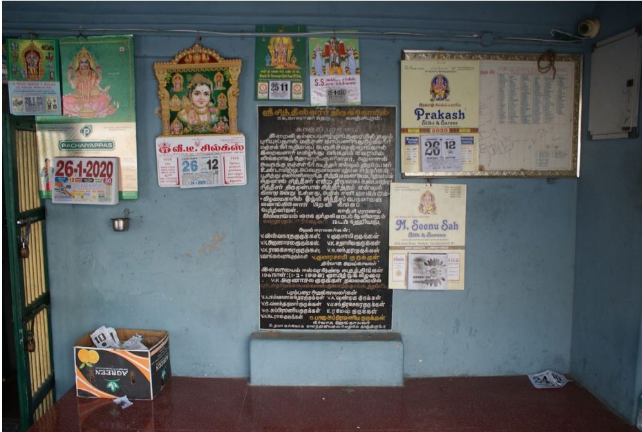
Abb. 5: Steintafel mit Zusammenfassung der Ursprungsgeschichte im Siddheśvara-Tempel.

weitgehend in Vergessenheit geraten ist. Dies wird auch im Siddheśvara-Tempel deutlich. Beim Betreten des Tempels finden die Besucher:innen eine Steintafel vor, in die eine Zusammenfassung der Ursprungsgeschichte des Tempels eingraviert ist (Abb. 5). Diese Zusammenfassung beruht auf dem KP und erwähnt diesen Text explizit als seine Quelle. Auch die mündlichen Versionen der Tempellegenden, die von den Tempelpriestern tradiert werden, beruhen im Fall der Shiva-Tempel Kanchipurams meist auf dem KP. Dies trifft auch auf die Ursprungsgeschichte des Siddheśvara-Tempels zu, die der örtliche Priester in einem 2008 von Ute Hüsken geführten Interview nacherzählte. In anderen Fällen weichen die Textüberlieferung und die mündlichen tradierten Nacherzählungen jedoch voneinander ab, sodass ihr Vergleich zu interessanten neuen Erkenntnissen führen kann. Daher dokumentiert das Projekt auch die mündlichen Versionen der Tempellegenden in Form von Interviews mit den Tempelpriestern und integriert sie in die digitale Edition.