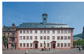
Heidelberg, Alte Universität

Angenommene Manuskripte erhalten ein hochwertiges wissenschaftliches Lektorat in deutscher und englischer Sprache. Die Publikationen werden durch den Verlag professionell gesetzt. Eine weitere Veröffentlichung bei einem anderen Verlag oder auf einem Repositorium ist nach Erscheinen des Buches jederzeit möglich: heiUP lässt sich von seinen Autorinnen und Autoren keine exklusiven, sondern lediglich einfache Nutzungsrechte übertragen.