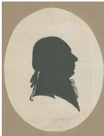
Abb. 2. Markgraf Carl Friedrich (1728–1811), Schattenriss (Karlsruhe, GLA, 69 Baden, Sammlung 1995, G 614)

Mitten inne [im Fasanengarten] ist ein grosses Bassin, welches jederzeit voller wilder Enten, um dasselbige aber stehen 4. Pavillons, in Form von Türckischen Zelten gemacht, davon zwey vor Vogel-Häuser dienen, die andere beyde aber sind Cabineter, vorne mit grünen Vorhängen von grünem Tuch zugemacht, und liegen gewisse Polster nach der Morgenländischen Weise darinnen. An diesem angenehmen Ruhe-Platz hält sich täglich der Marggraff etliche Stunden auf, und hat er ordinaire einige von den Mädgens bey sich, welche, gleichwie er sie in der Music hat unterrichten lassen, also machen sie dahier die angenehmsten Concerten. [...] Zu Mittag speiset er ordinaire nur in einer Gesellschaft von vier Personen, und haben die Weibsleute, so er an seinem Hofe hält, die Aufwartung dabey. Es sind deren an der Zahl 60. doch haben ihrer täglich nicht mehr als 8. die Aufwartung. Wann der Marggraff ausfähret, folgen ihm selbige als Hussaren gekleidet zu Pferde nach. Der mehreste Theil von ihnen verstehet nebst der Music auch das Tantzten, und wird die Opera auf dem Hoff-Teatro von ihnen gespielt, sonsten auch die Kirchen-Music durch sie versehen, und logieren sie allesamt bey Hoff. 21