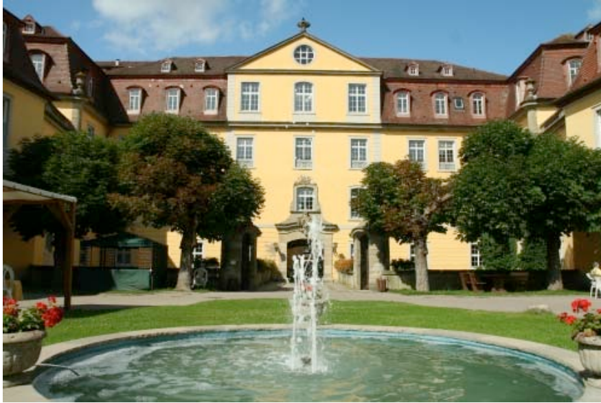
Abb. 6. Schloss Kirchberg an der Jagst