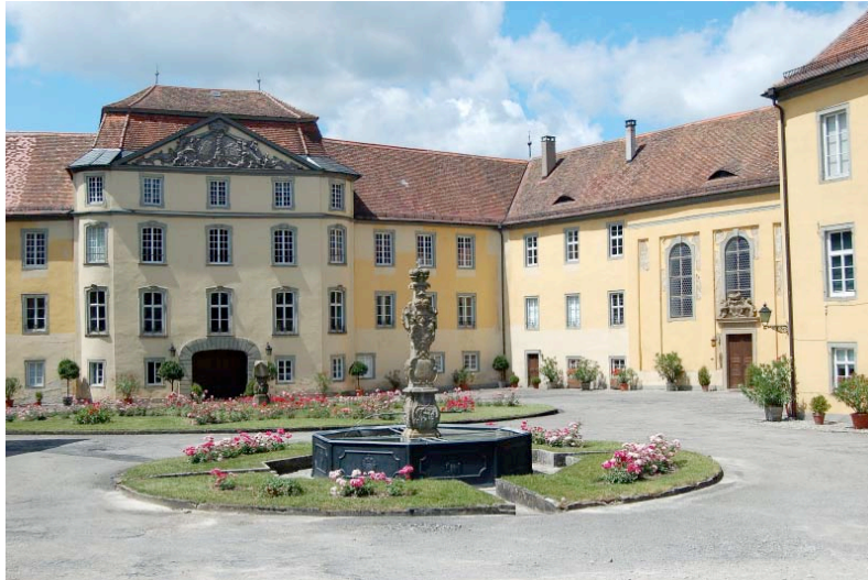
Abb. 3. Schloss Bartenstein

Das Musikleben in Bartenstein und in Öhringen ist vor allem durch aufbewahrte Musikalienbestände dokumentiert, die heute ebenfalls im Hohenlohe-Zentralarchiv auf Schloss Neuenstein liegen.