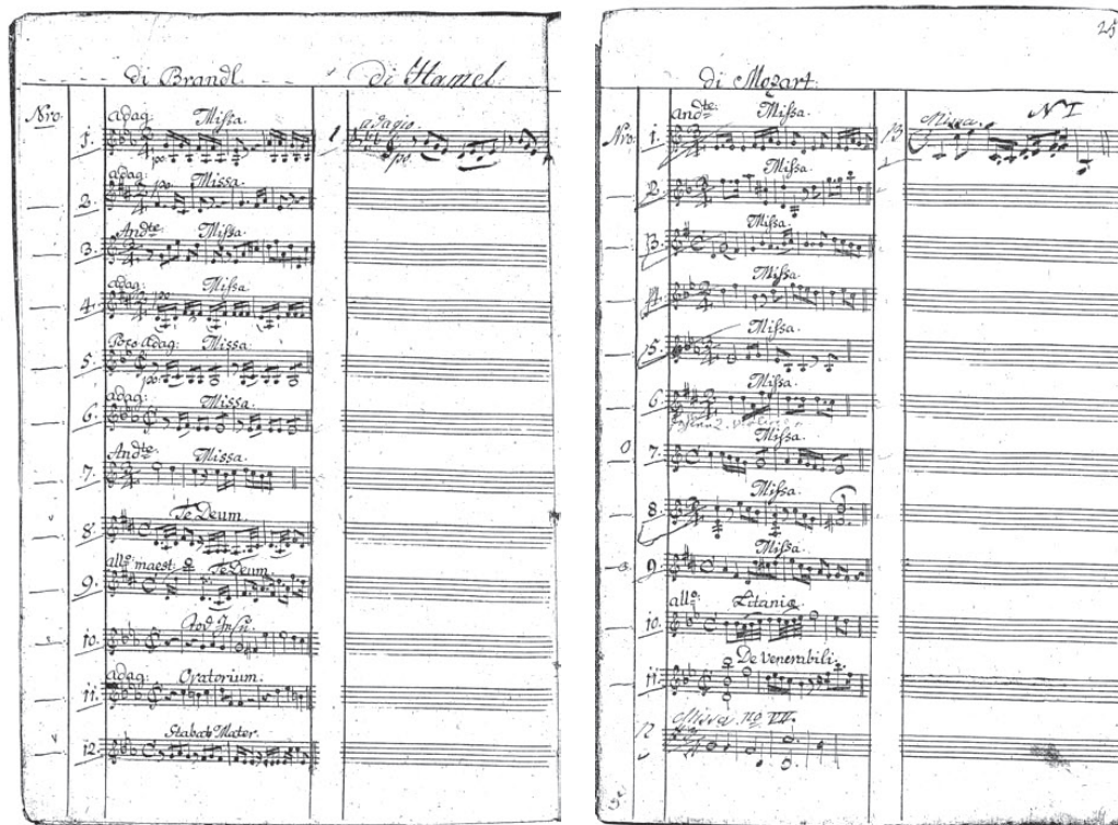
Abb. 7–8. Die kirchenmusikalischen Werke des Hofkapellmeisters (bis 1789) Johann Evangelist Brandl und die Messe – so laut Inventar von 1836 – von Ham(m)el sowie die kirchenmusikalischen Werke von Mozart im Bartensteiner Inventar von 1797

1. Inventar von 1797 (Hohenlohe-Zentralarchiv Schloss Neuenstein, ohne Signatur). Im ersten Teil des Inventars (1v–29r) wird zu jedem Stück ein Incipit angegeben (s. Abb. 7–8).