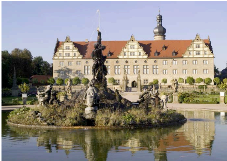
Abb. 1. Schloss Weikersheim, Gartenansicht