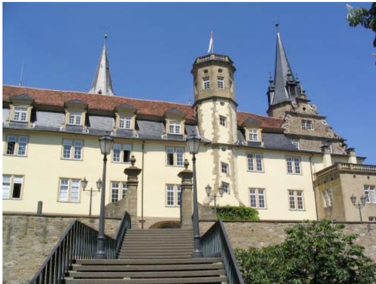
Abb. 4. Schloss Öhringen