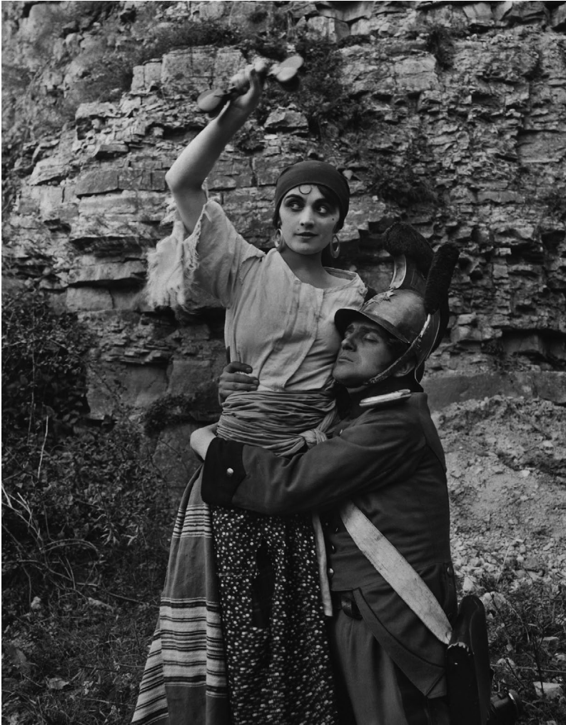
Abb. 1. Screenshot aus Carmen (1918). Don José Navarro (Harry Liedtke) verfällt der attraktiven Carmen (Pola Negri) hoffnungslos.