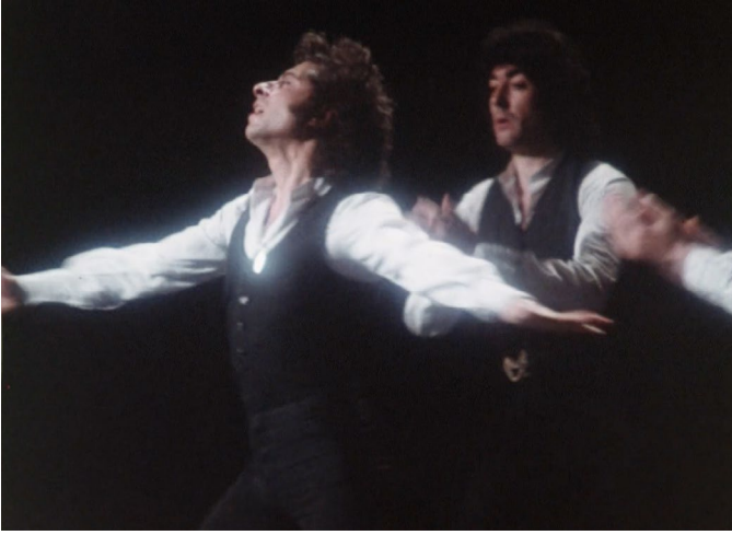
Abb. 13. Sich freitanzen [00:08:23].

Minderheit thematisiert. Im erneuten Aufgreifen der bereits durch Camelamos naquerar geprägten Pose wird das Antanzen gegen Fesseln pathosformelartig zum Sinnbild für die rassistische Diskriminierung der Gitanos , aber auch für die Hoffnung auf das Zugeständnis gleicher Bürgerrechte. 65