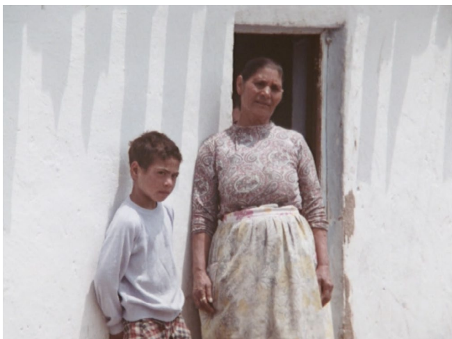
Abb. 7. Den Blick erwidern. Screenshot einer dokumentarischen Sequenz aus der Gemeinde Iznalloz [00:06:29].