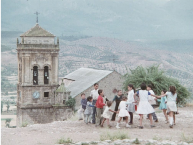
Abb. 9. „Soy un pueblo inocente“ – „Ich gehöre einem unschuldigen Volk an“ [00:05:58].

Die dokumentarischen Sequenzen zeigen darüber hinaus überwiegend jene Personengruppen, die mit besonderer Schutzlosigkeit in Verbindung gebracht werden: (Klein-)Kinder, Jugendliche, betagte Menschen sowie Mütter mit Säuglingen. Betroffen von den in teilweise sehr großer zeitlicher Ferne zum Betrachter erlassenen Gesetze ist folglich nicht ein anonymes Kollektiv, sondern eine Auswahl konkreter Personen. Die (historisch) verfolgte Minderheitengruppe bekommt im wahrsten Sinne des Wortes ein Gesicht. Die Unbedarftheit und Unschuld der gezeigten Personen – Kinder tollen herum, Mütter wiegen ihre Säuglinge – steht dabei im scharfen Kontrast zu den Gesetzen ( Abb. 9 ). Die Position der Gitanos als schuldlos Verfolgte wird gegen Mitte des Werks durch Sänger Antonio Gomez auch direkt verbalisiert: „Soy un pueblo inocente“ – „Ich gehöre einem unschuldigen Volk an“, lautet die Verszeile einer romance , die der cantaor mit wehklagendem Timbre anstimmt. 55