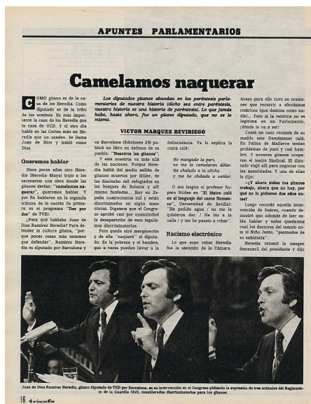
Abb. 14. Camelamos naquerar als Slogan der Bürgerrechtsbewegung – Abgeordneter Ramírez Heredia spricht sich für eine Abschaffung der polizeilichen Sonderkontrolle der Gitanos aus.

Abschaffung der Verordnung für polizeilichen Sonderkontrolle der Gitanos einsetzte. 70 Die Gleichstellung aller spanischen Staatsbürger*innen, unabhängig von „ethnischer Zugehörigkeit, Geschlecht, Religion“ sollte wenig später, im Dezember 1978, durch Artikel 14 der ersten demokratischen Verfassung des Landes seit der Zweiten Spanischen Republik – zumindest konstitutionell – besiegt werden. 71