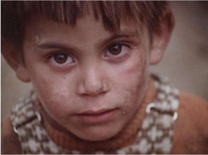
Abb. 10. Kameraperspektive und hierarchisierender Blick [00:09:57].

hierarchisierende Wirkung entfalten die in Aufsicht gezeigten Bilder einzelner (Klein-)Kinder ( Abb. 10 ) Die Kameraperspektive verstärkt den Eindruck von Hilflosigkeit und Unschuld, der ohnehin mit Kindern in Verbindung gebracht wird. Zwar begünstigt die Perspektive das Aufkommen von Mitgefühl beim Rezipierenden, jedoch blickt dieser gleichzeitig aus der „privilegierten Position“ eines ethnographic gaze auf die Vertreter*innen der Minderheit herab und macht „diese im Prozess des Othering erst zum Objekt und ‚Fremden‘“. 62