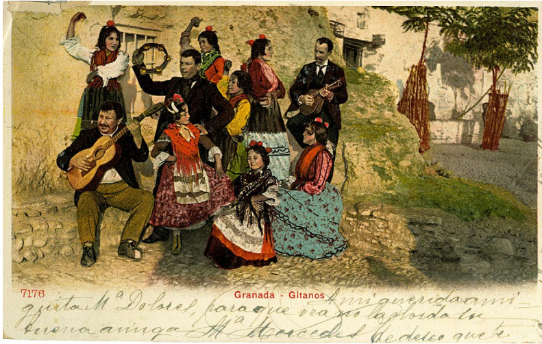
Abb. 2. Enrique Linares, Kolorierte Bildpostkarte Granada – Gitanos , um 1910.

Auch wenn (bis heute) in Fachkreisen und unter aficionados polemische Debatten über Beitrag und Rolle der Minderheit bei der Entwicklung dieser Musikkultur geführt werden, entwickelte sich der Motivkomplex des Flamenco in bildkünstlerischen wie literarischen – später auch filmischen Repräsentationen – zum zentralen Marker spanischer gitano -Figuren. 27 Befördert durch literarische Reiseberichte und pittoreske Genreszenen französischer und britischer Kunstschaffender war die Verbindung zwischen der Minderheit und dem Flamenco bereits gegen Ende des 19. Jahrhunderts so stark im kulturellen Gedächtnis Europas verankert, dass Zitate einzelner Elemente ausreichend waren, um bei Rezipierenden entsprechende Assoziationsketten anzustoßen. 28 Exemplarisch kann dies anhand einer um 1910 in Granada aufgenommenen fotografischen Genreszene aufgezeigt werden (Abb. 2).