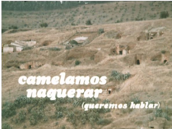
Abb. 4. Screenshot der Anfangsszene von Camelamos naquerar (1976) [00:00:01].

Evident wird der sozialkritische Impetus des Films bereits in der Eingangsszene. Camelamos naquerar beginnt mit einer Sequenz aus Aufnahmen der andalusischen Kleinstadt Guadix ( Abb. 4 ). Während verschiedene Long-Shot-Einstellungen – von Panorama bis Halbtotale – eine visuelle Inventur der Siedlung liefern, eröffnet ein männlicher Off-Sprecher den Film durch ein Statement zum politischen Anspruch des darauf Folgenden: „ Camelamos naquerar ist ein Werk, das es sich zum Ziel gesetzt hat, eine bestimmte Situation der Ungerechtigkeit anzuprangern. Die Form des Rassismus, welche die Gitanos trifft, seitdem die Katholischen Könige Ende des 15. Jahrhunderts in Medina del Campo ein grausames Dekret unterzeichneten, das auf Auslöschung aller Gitanos abzielte.“ 49 Da die Diskriminierungsgeschichte der iberischen Roma bis dato weder in gesellschaftlichen noch wissenschaftlichen Diskursen breitere Beachtung gefunden hatte, erscheint die damit für den Rezipierenden vorgegebene Lesart des Werks durchaus progressiv. 50