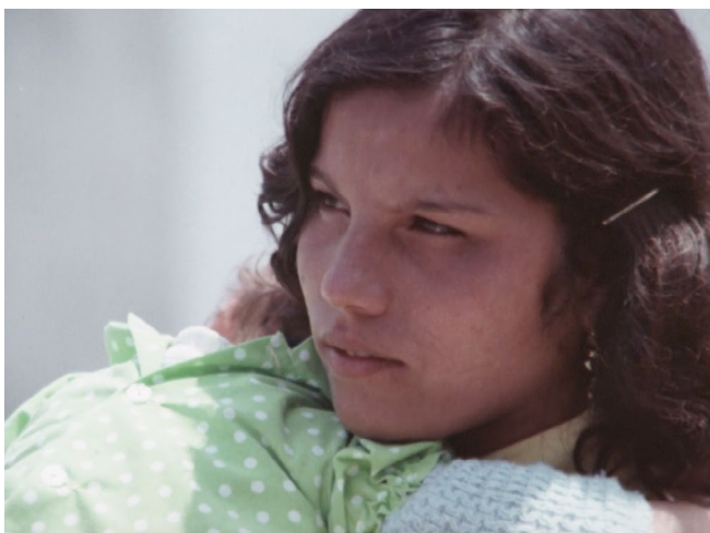
Abb. 8. Dem marginalisierten Kollektiv ein Gesicht geben [00:06:37].