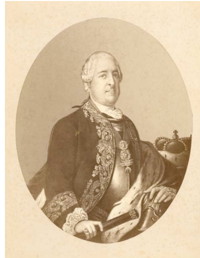
Abb. 3. Markgraf August Georg (1706 – 1771), Fotodruck nach einem Gemälde, Karlsruhe, Schuhmann & Söhne

Auch mit Blick auf die Organisation der Hofkapelle sind die Instruktionen die wichtigsten noch vorhandenen Quellen. So regelte bereits der dreizehn Punkte umfassende Erlass von 1737 neben der Besetzung an Feiertagen unter den Punkten sieben bis zwölf Fragen der Arbeitsteilung und der Disziplin. Über die allgemeine Verpflichtung zu Gehorsam gegenüber den Vorgesetzten und Achtung auch vor den Untergebenen hinaus, werden die komponierenden Mitglieder der Hofkapelle zum kontinuierlichen Schreiben neuer Werke verpflichtet. Punkt neun regelt die Hierarchie innerhalb der Kapelle. Der letzte Abschnitt verlangt nach einer genauen Meldung über abhanden gekommene Noten und Instrumente.