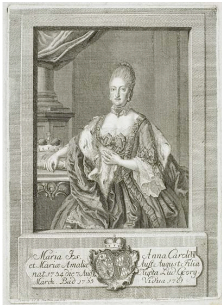
Abb. 2. Markgräfin Maria Anna Josepha (1734–1776), Kupferstich 1773

Vesper erklingen. An Gründonnerstag und Karfreitag waren die Musiker außerdem verpflichtet, »Bey Besuchung derer Heyl. Gräber eine Vocal Music« aufzuführen.