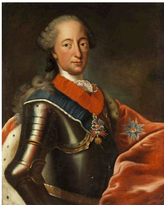
Kurfürst Maximilian III. Joseph von Bayern (1727–1777), Ölgemälde von Georges Desmarées (Werkstatt)

Besonderen Nachdruck legte auch er auf die Verpflichtung berühmter Gesangsvirtuosen (u. a. Giovanni Carestini, Carlo Broschi [Farinelli], Faustina Bordonì). Besonders begabte Sänger und Instrumentalisten ließ er in Italien ausbilden. Als er im Februar 1742 in Frankfurt zum deutschen Kaiser Karl VII. gekrönt wurde und zwei Tage später im Österreichischen Erbfolgekrieg österreichische Panduren München besetzten, kam hier das höfische Musikleben gänzlich zum Erliegen. Ein Teil der Hofmusiker war dem Kaiser zu seiner Krönung nach Frankfurt gefolgt. Als er endlich im Oktober 1744 in seine alte Residenzstadt zurückkehren konnte, war er ein schwer kranker Mann 10 . Nach seinem Tod im Januar 1745 trat der 18-jährige Max III. Joseph sein belastetes Erbe an. Er sah sich zu äußersten Einschränkungen veranlasst, seine Hofkapelle wurde bedeutend verkleinert. Abgesehen von der zur Hochzeit des Kurfürsten 1747 gegebenen, unter Karl VII. nicht mehr zur Aufführung gelangten opera seria La Clemenza di Tito des in-