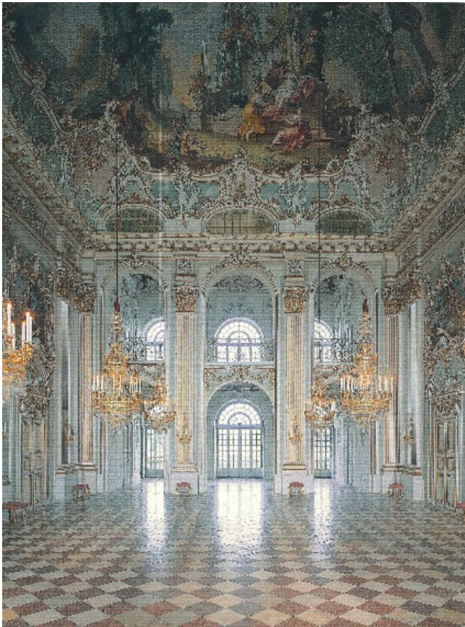
Der Steinerner Saal im Mittelbau des Schlosses Nymphenburg (aus: Münster, »ich würde München gewis Ehre machen«. Mozart und der Kurfürstliche Hof zu München, S. 23, Abb. 9)

Was die Instrumentalbesetzung bei den Opern betrifft, geben die Hofkalender keine verlässliche Auskunft. So enthält beispielsweise eine Personenliste zu Achille in Sciro von Pietro Pompeo Sales (1774) 24 Instrumentalisten, von denen acht nirgends in den Hofkalendern genannt sind. Bei Michls Il Trionfo di Clelia 1776 spielten 18 Instrumentalmusiker, der Chor bestand aus 30 Personen, im Jahr zuvor bei Tozzis Orfeo ed Euridice sangen 48 Choristen. Zu Mozarts Idomeneo existiert ein offenbar nicht ganz vollständiger, in die Aufführungspartitur eingelegter Besetzungszettel ohne Musikernamen. Einer darauf beruhenden Rekonstruktion der tatsächlichen Besetzung ist im Folgenden die Zahl der im Gesamten verfügbaren Orchestermusiker gegenübergestellt: Violine 12 (25), Viola 2 (5), Violoncello 2 (5), Kontrabass 2 (5), Flöte mit Flauto piccolo 3 (4), Oboe 2 (4), Fagott 2 (3), Klarinette 2 (3), Horn 2 (8), Trompeten 2, Pauke 1. Die Holzbläser spielten hier nicht während der ganzen Oper. Sie wechselten sich einem Vermerk zufolge im Verlauf der Oper ab 25 . Die Aufführungen der Hofopern waren auch gebildeten Gästen zugänglich.