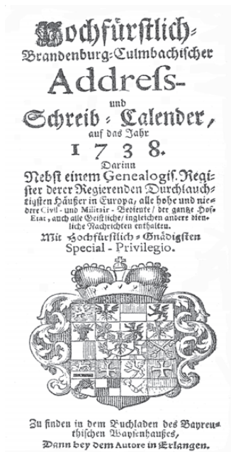
Abb. 1. Erster erhaltener Hofkalender (1738)

Reiches Quellenmaterial enthält die Sammlung des Brandenburg-preußischen Hausarchivs , die 1995 aus Merseburg nach Berlin-Dahlem in das Geheime Staatsarchiv zurückgekehrt ist 21 . Als weitere wichtige Informationsquelle sind die Bayreuther Zeitungen (ab 1736) zu nennen, deren Verwahrung sich die Universitätsbibliothek und das Stadtarchiv Bayreuth teilen 22 . So veröffentlichte Wilfried Engelbrecht 1993 daraus einen kurzweiligen, bebilderten Gang durch die Kulturgeschichte Bayreuths im angegebenen Zeitraum 23 .