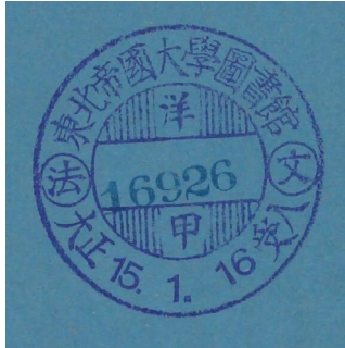
Abbildung 2: Stempel der Universitätsbibliothek Tōhoku

Die Bibliothek der Universität Tōhoku (Nordost), gelegen in Sendai in der Präfektur Miyagi in Japan, der auch die Bibliothek Wilhelm Wundts gehört, verfügt über eine Sammlung Schreibhefte 197 mit handgeschriebenen Aufzeichnungen Wilhelm Windelbands.